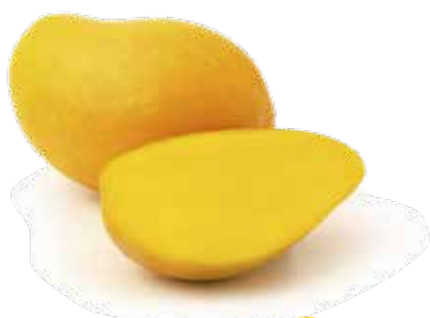
ATAULFO / HONEY

la maduración, coloquen el mango en una bolsa de papel. Una vez que esté maduro, el mango debe moverse al refrigerador, lo cual frenará el proceso de maduración. El mango entero y maduro puede almacenarse por hasta cinco días dentro del refrigerador. El mango se puede pelar, cortar en cubitos, y colocar en un recipiente con sello hermético en el refrigerador por varios días, o en el congelador por hasta seis meses.