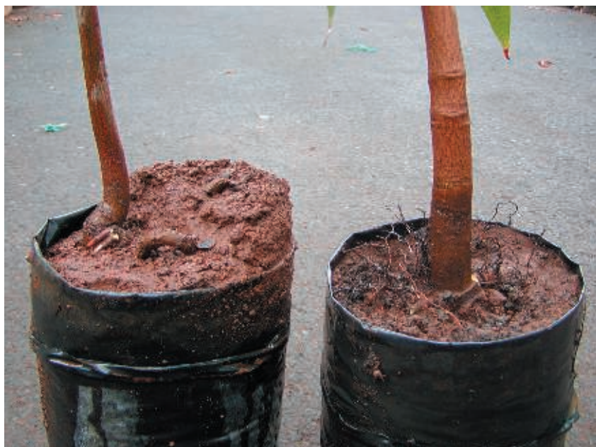
Figura 3. Planta con deformación radical aparente (izquierda) y sin deformación radical aparente (derecha)