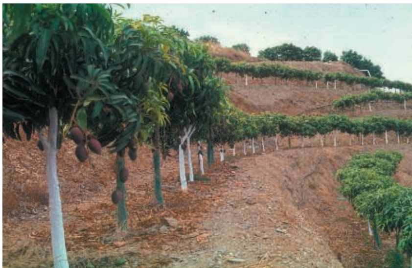
Fig.1. Plantación de mangos en terrazas

Antes de las labores de limpieza y arado de suelo debe realizarse un análisis de suelo para determinar los nutrientes a añadir de cara a una adecuada producción. Las muestras de suelo deben tomarse a dos profundidades, 0-20cm y 20-40cm. Es especialmente importante determinar el pH del suelo - óptimo para mango entre 5,5 y 7,0 - para estimar la necesidad de realizar un encalado o incorporación de yeso al suelo. La aplicación de ambas enmiendas, yeso (azufre) para \text{pH} > 7 o carbonato o fosfato cálcico para suelos de bajo pH debe realizarse antes de la labor de arado del suelo (véase sección de preparación del terreno): Igualmente es recomendable realizar una enmienda orgánica antes de dicha labor en aquellos suelos con un contenido en materia orgánica inferior al 2%.