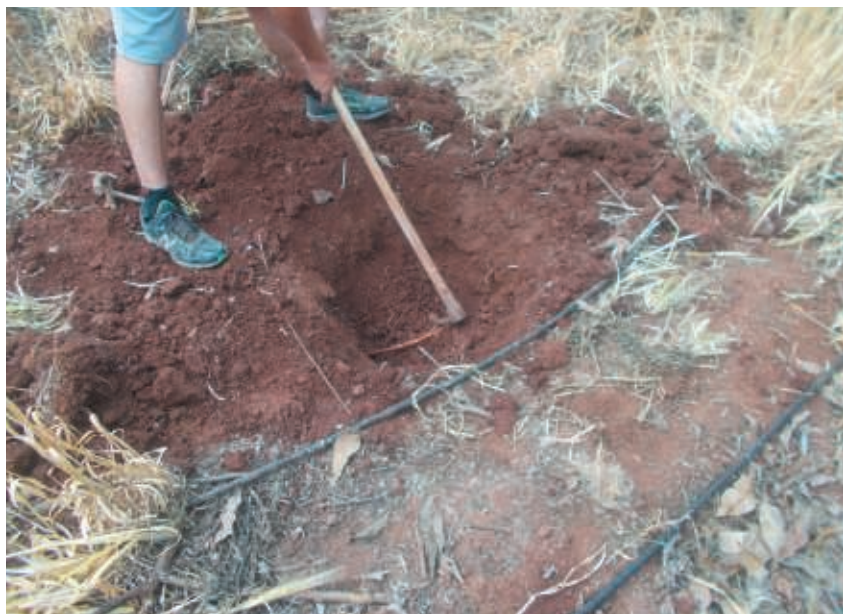
Figura 7. Apertura manual del hoyo de plantación