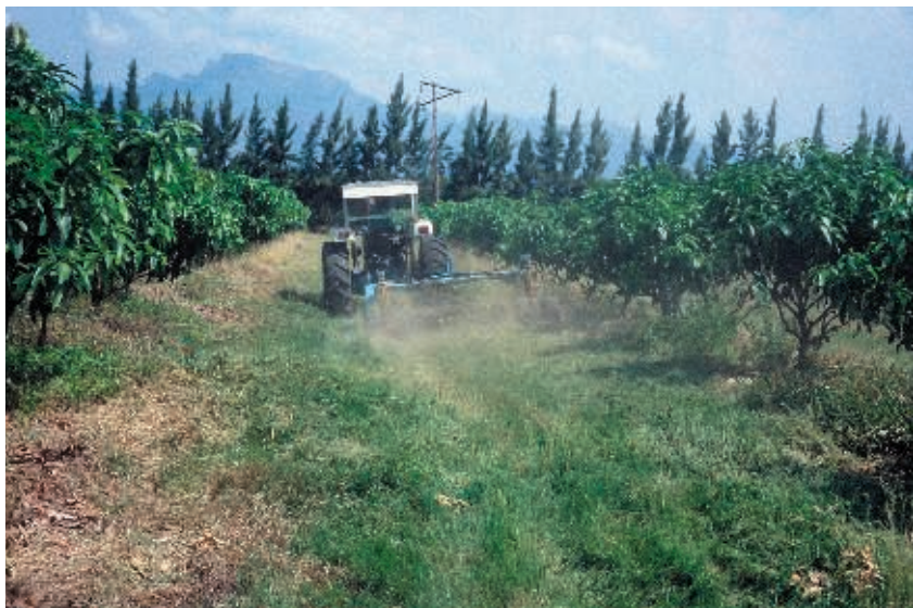
Figura 5. La plantación a marco rectangular facilita la mecanización