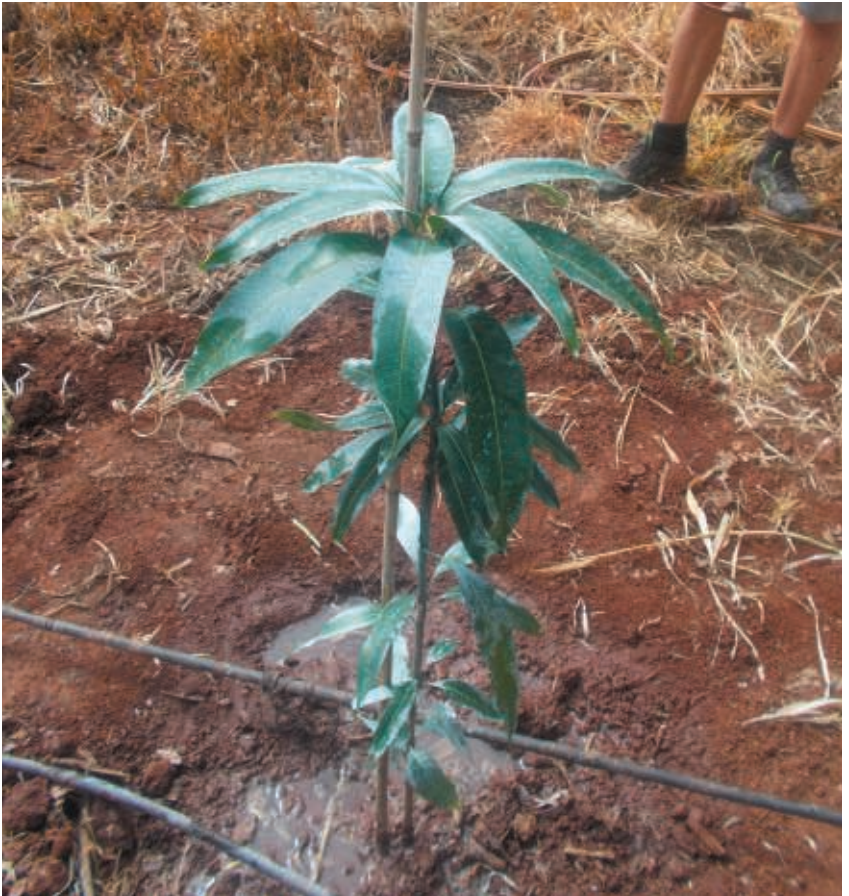
Figura 12. Aplicación de un buen riego tras la plantación

Es conveniente realizar un riego profundo tras la plantación y posteriormente los árboles deben regarse regularmente hasta que estén bien establecidos en el terreno y las raíces estén creciendo en el suelo alrededor del hoyo (Fig. 12). El intervalo entre riegos depende de las condiciones climáticas y del tipo de suelo, pero puede ser necesario regar al menos dos veces a la semana durante las 4 primeras semanas. Hay que tener cuidado en no excederse demasiado en la cantidad de agua a aportar ya que se puede provocar pudrición de raíces.