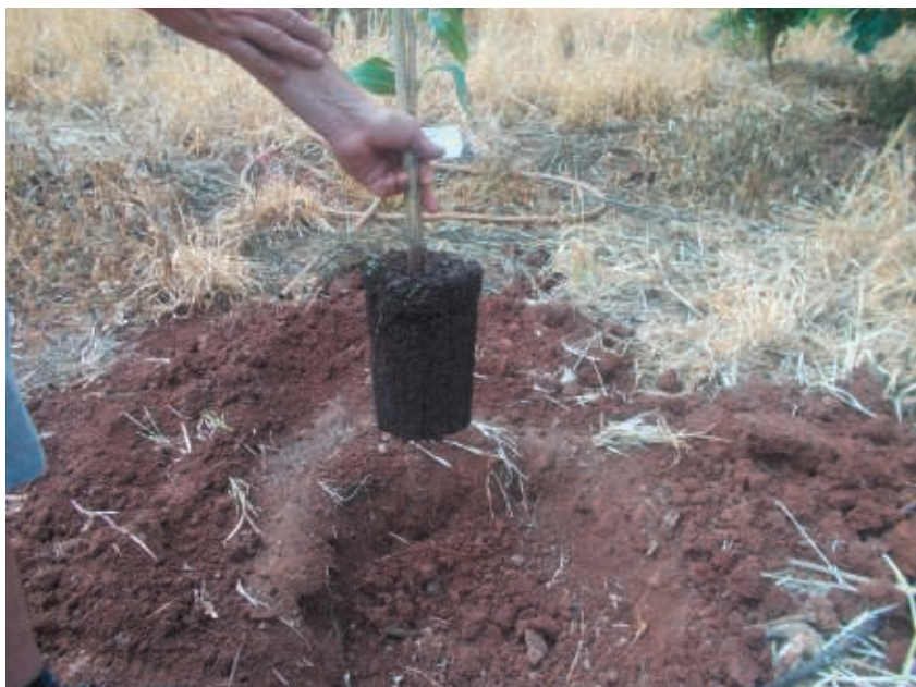
Figura 6. Planta ya extraída de la bolsa con su cepellón intacto

La posición final de los árboles se decide de acuerdo con el diseño de plantación escogido y puede marcarse con una estaca o tutor apropiado que luego puede ser utilizado para el entutorado de la planta. En el caso de que no se haya instalado con anterioridad el sistema de riego este es el momento para hacerlo.