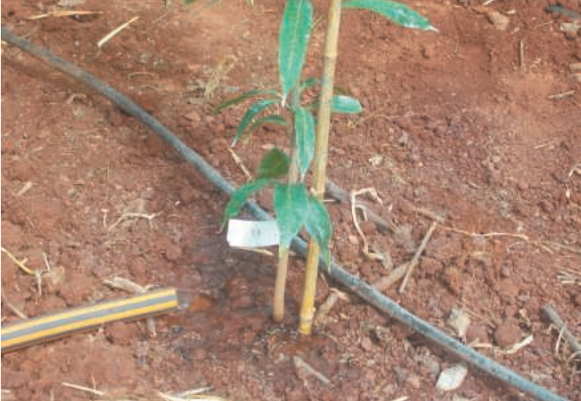
Figura 9. Planta ya sembrada con un tutor de soporte