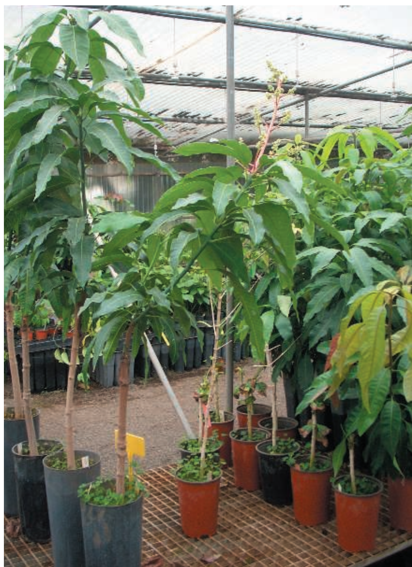
Figura 2. Planta apropiada para plantación (izquierda) y desechable por floración en vivero (derecha)