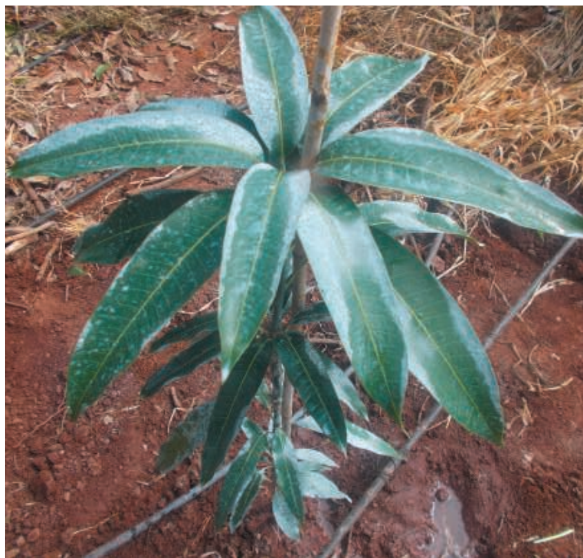
Figura 11. Planta asperjada con caolinita como protección de una excesiva insolación