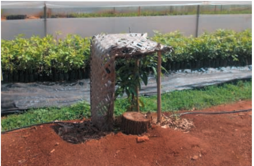
Figura 10. Protección de plantas de la excesiva insolación

Si se está en un emplazamiento ventoso debe plantarse el árbol con el injerto orientado de cara al viento dominante para evitar su rotura e incluso atar la planta a un sólido tutor por medio de una cinta de tela, caucho o similar lo suficientemente suelta para evitar que se produzca un anillado del árbol cuando crezca el tronco. Si se está en un área con riesgo de helada debe envolverse el tronco con algún material aislante y cubrir con plástico o hierba la parte alta del árbol por las noches y comienzo de la mañana durante el invierno. Si estamos en una región con riesgo de una elevada insolación debe protegerse el árbol pintando el tronco y las ramas principales con lechada de cal o pintura blanca apropiada, asperjando algún producto protector o utilizando una malla específica para este fin (Fig. 10 y 11). En zonas con abundantes conejos u otros roedores debe protegerse el árbol con un tubo de plástico u otra medida protectora adecuada.